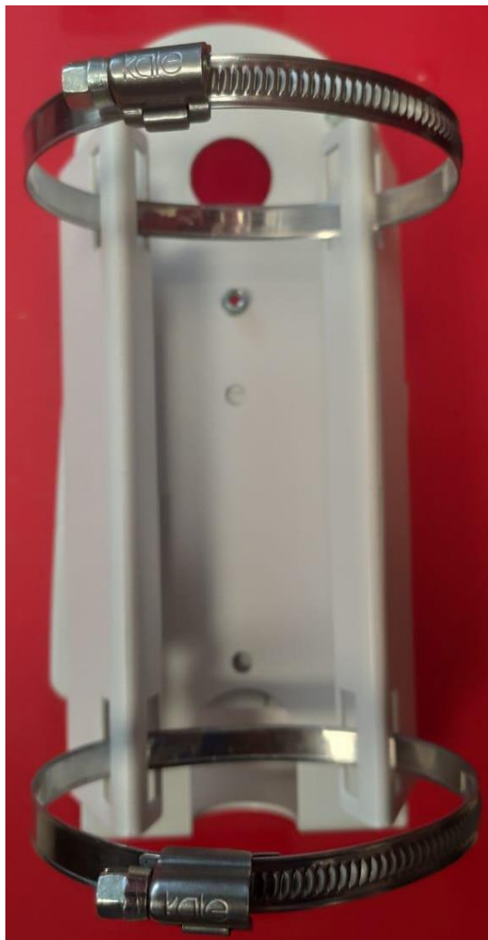
Рисунок 1 Вид кронштейна со стороны крепления к опоре

Усилие натяжения хомутов определяется материалом опоры, на которую будет крепиться кронштейн.